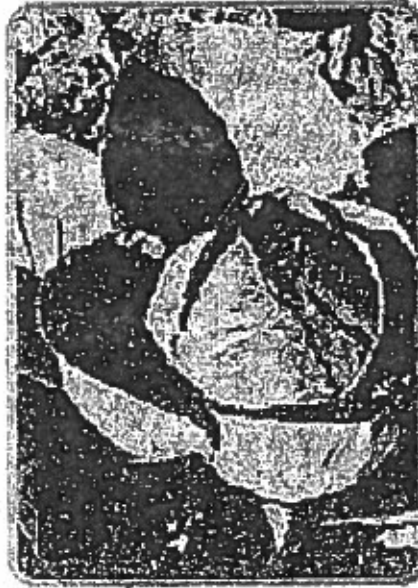
Resim 4 - Mahrenkopf