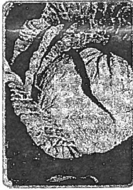
Resim 3 – Yalova